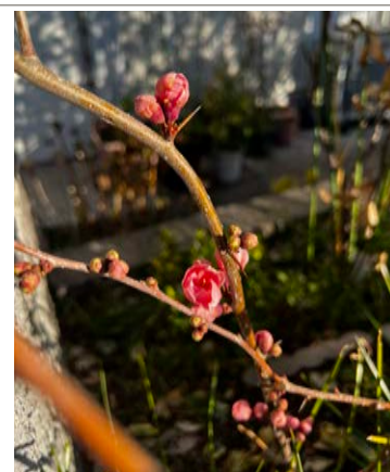
寒空のもとですが、小さな花が咲いていました。

阪神淡路大震災から29年が経ちますが、南海トラフ地震の事もあります。天災は忘れた頃にやってくるという言葉も、今一度思い出し、病院運営を預かる立場として、準備を進めておきたいと思います。（文責：狭間研至）